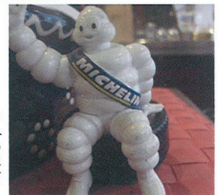
さりげなく飾られたミシュランのマスコット人形。ピバンダム。ちょっとしたところにフランス的な演出がほどこされている。