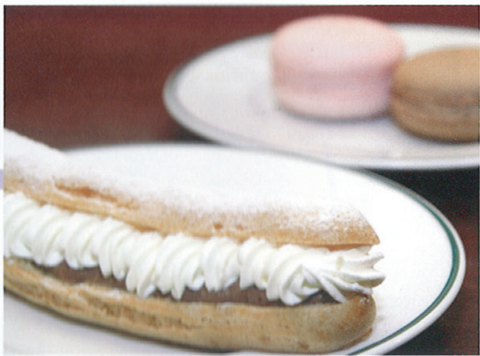
平日ランチにプラスできるデザートは2種類。しかもマカロンはテイクアウト可。