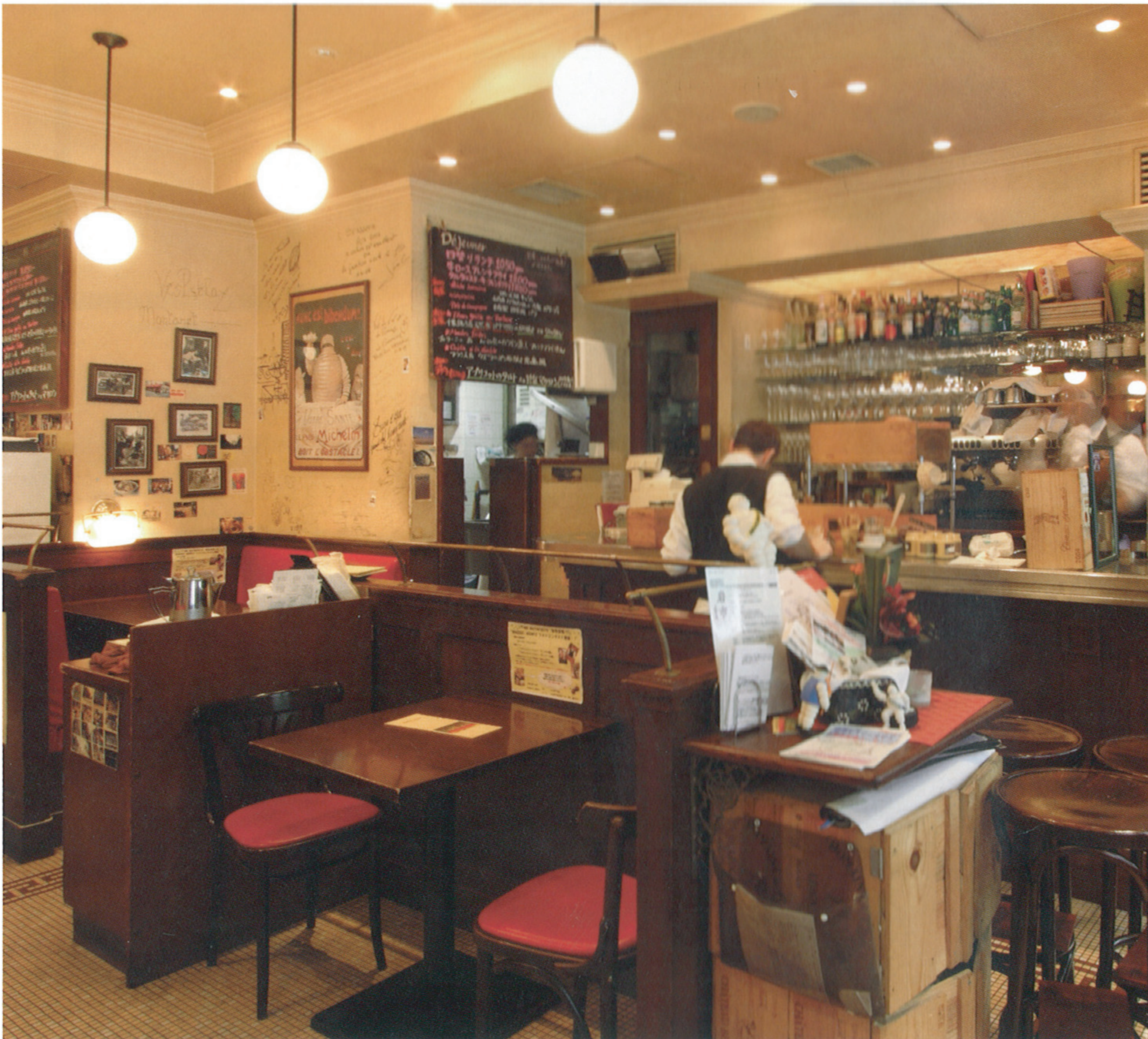
表にはテラス席があり、中に入るとカウンターと店内座席がある。店の構造もまさにパリのブラスリー。