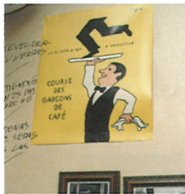
カフェのウェイトーをモチーフにしたウィットのきいたフランスのポスター。