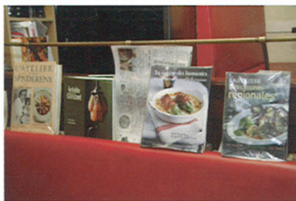
ディスプレイとして並べられた料理本は、ほとんどがシェフの私物。