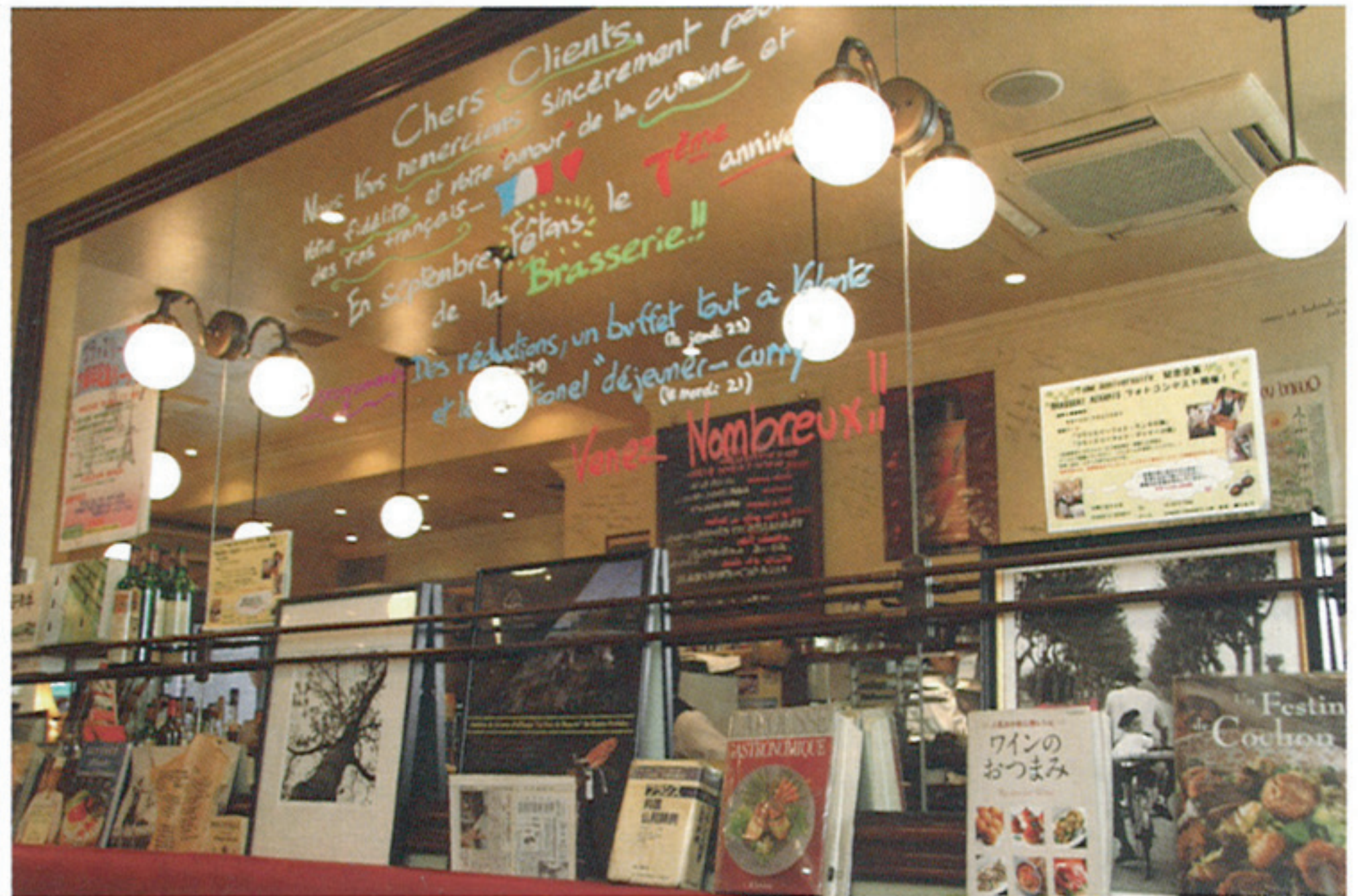
オザミの自慢はワイン。店内のいたるところに見られるサインはすべてワイン生産者のもの。