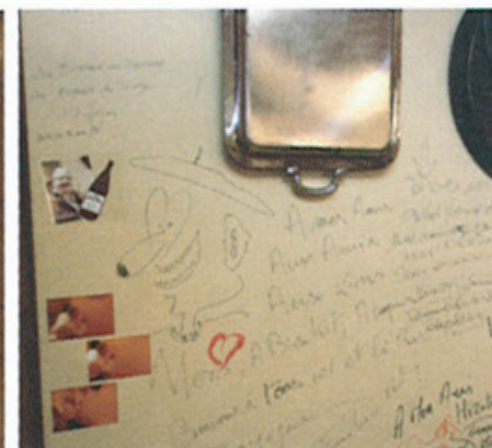
意外なものがディスプレイされた壁面は、アートスペースの様相を呈す。もはや落書きまでもがアートになっている。