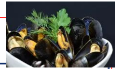
モンサンミッシェル産 ムール貝