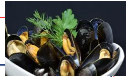
モンサンミッシェル産 ムール貝